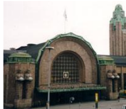
B.G. Eliel Saarisen suunnittelema Helsingin asemarakennus. Kuvaa klikkaamalla näet sen suurempana.