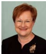
Tarja Halonen Tasavallan presidentti